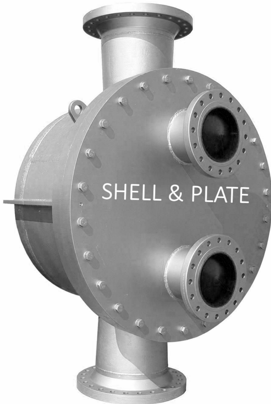
Plate & Shell Wärmeübertrager kombinieren die Vorteile von Plattenwärmeübertragern (Plate) & Rohrbündelwärmeübertragern in zylindrischen Mänteln (Shell).